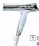
1 ホワイト RE-BC-02A