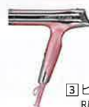
3 ピンク RE-BC-05A